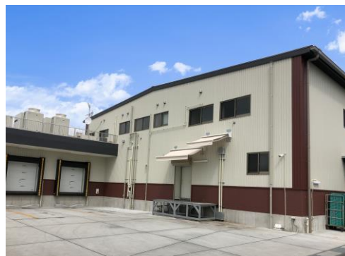
▲第五工場（2022年完成、稼働開始）