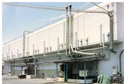
▲ 最新鋭のハイテクノロジーを導入した第三工場