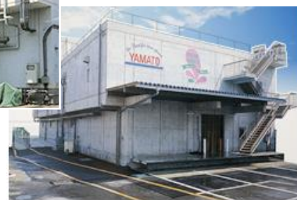
▲ 緑豆もやし専用の第二工場